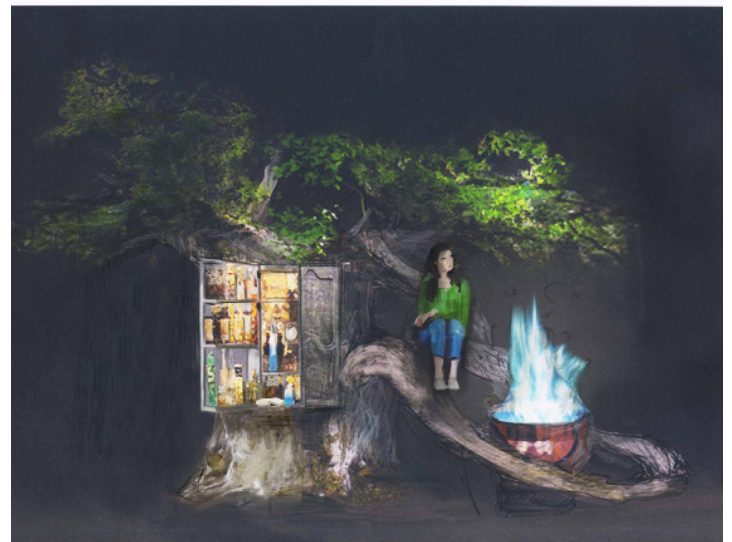
Dessins : Emmanuelle Roy