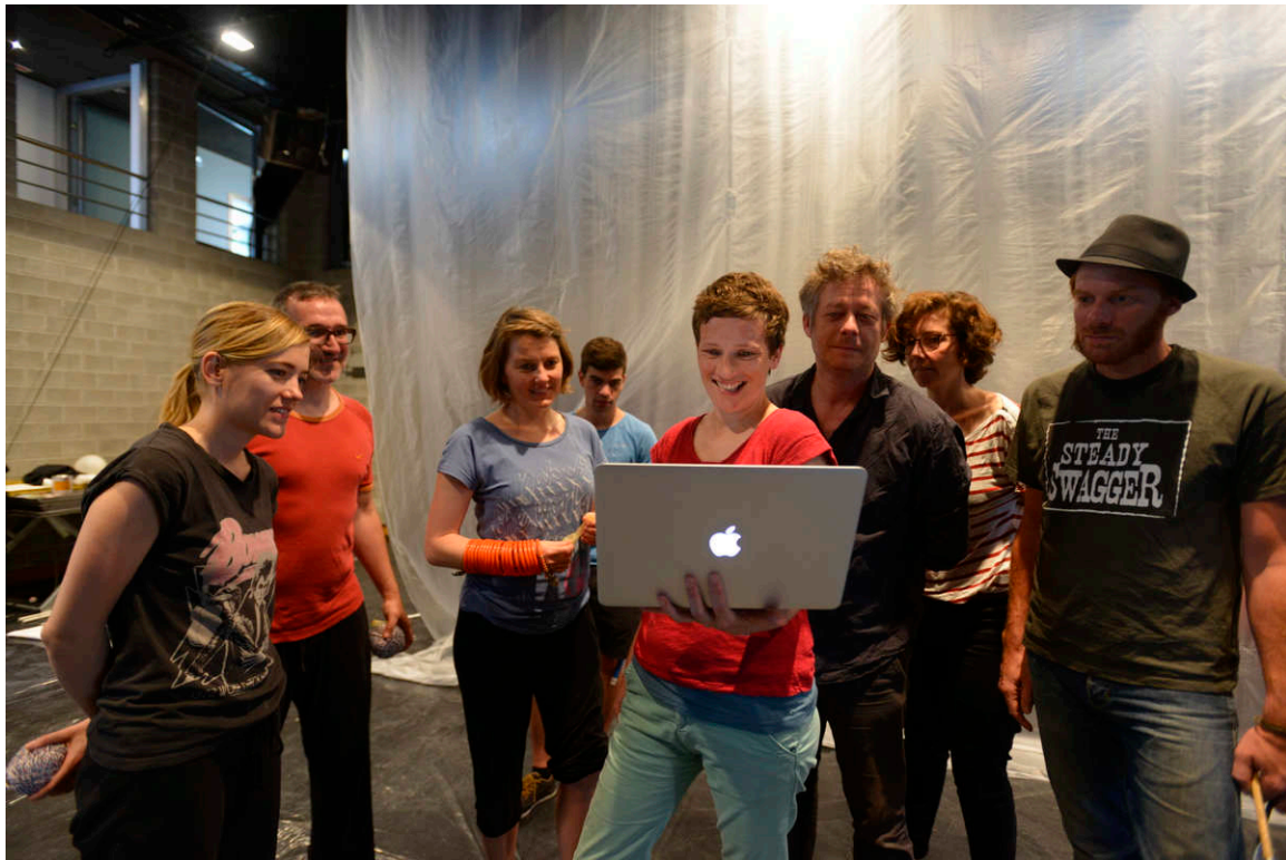
l'équipe artistique en juin 2016, premières séances de répétitions.