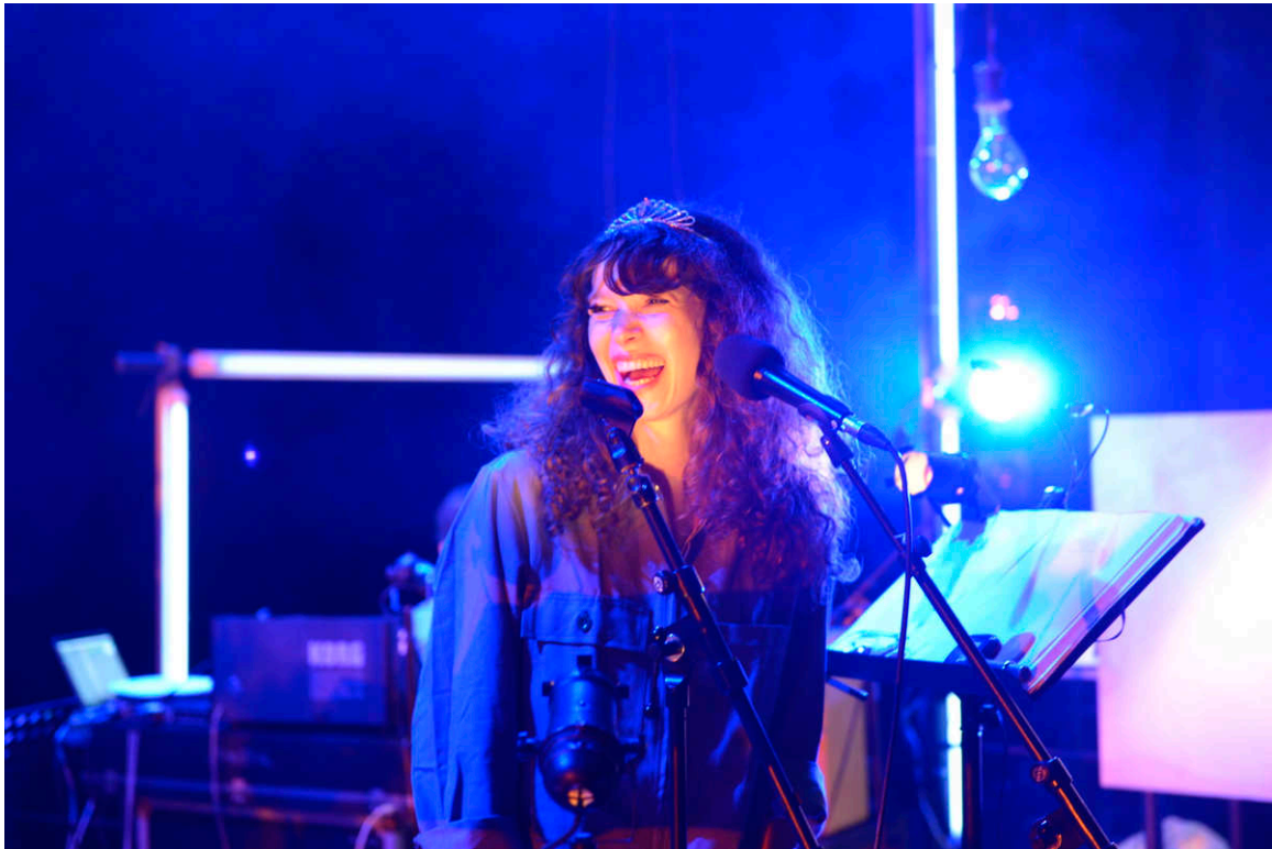
étape de travail juin 2016