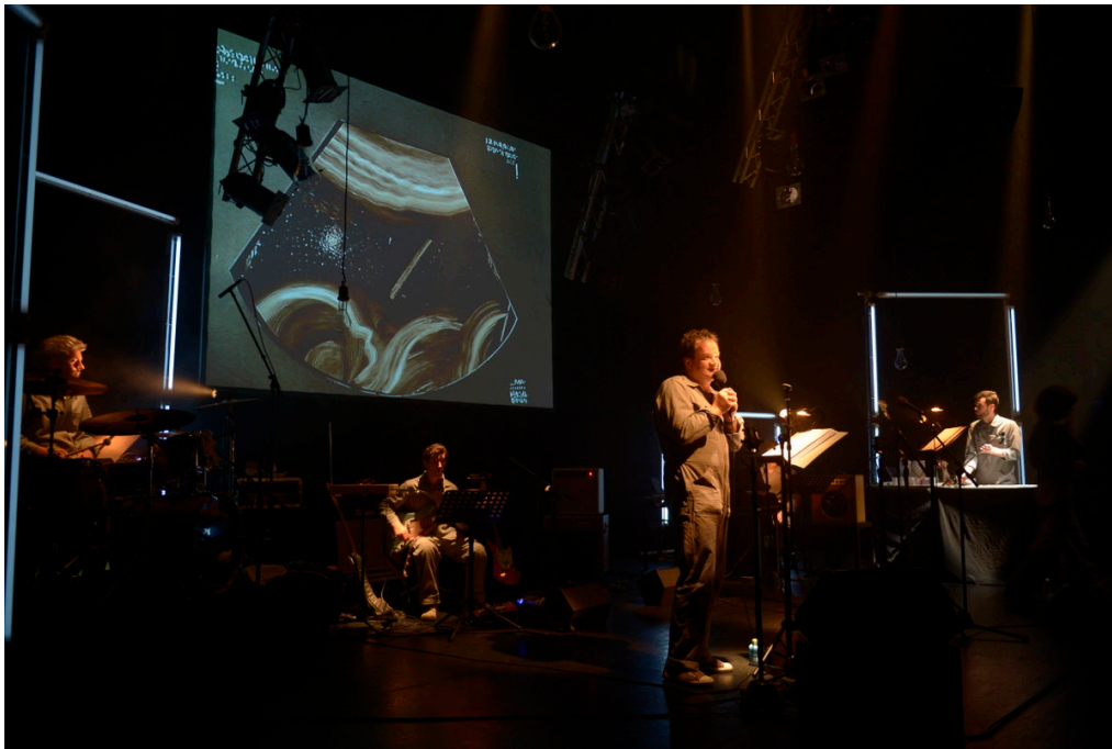
étape de travail juin 2016