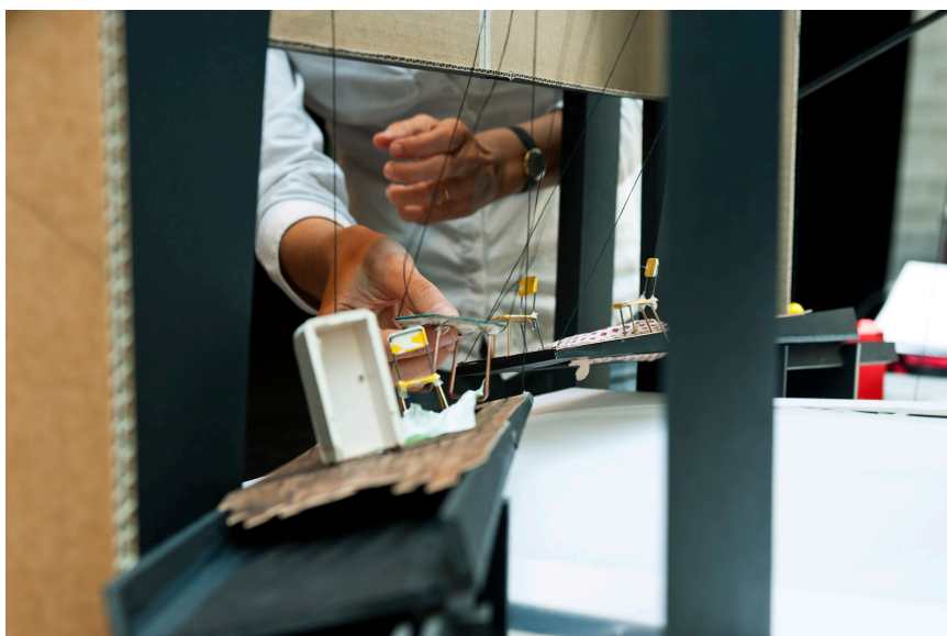
Maquette de la scénographie - détail – juin 2013 au Théâtre Am Stram Gram