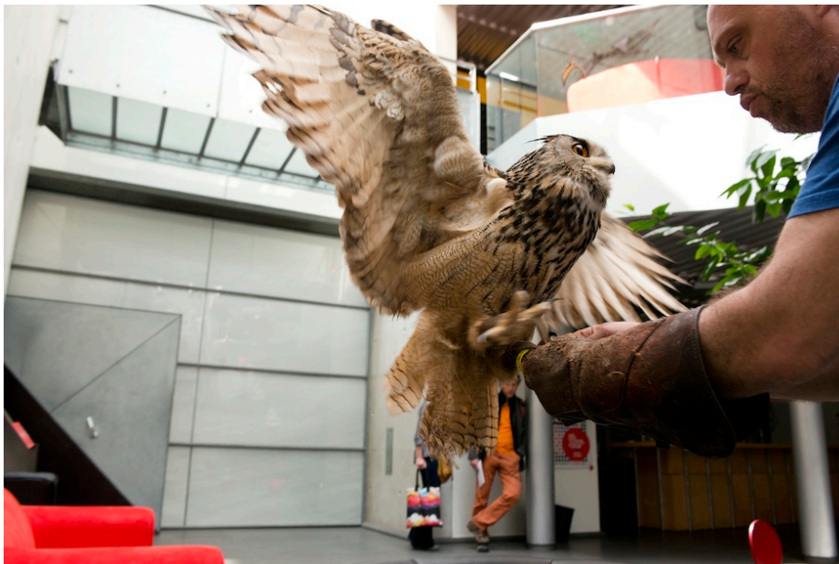
Vol dans le hall du Théâtre Am Stram Gram, juin 2013.