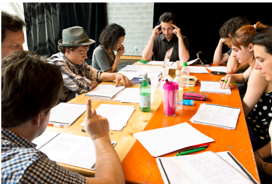
Premières répétitions à la table – juin 2013 au Théâtre Am Stram Gram