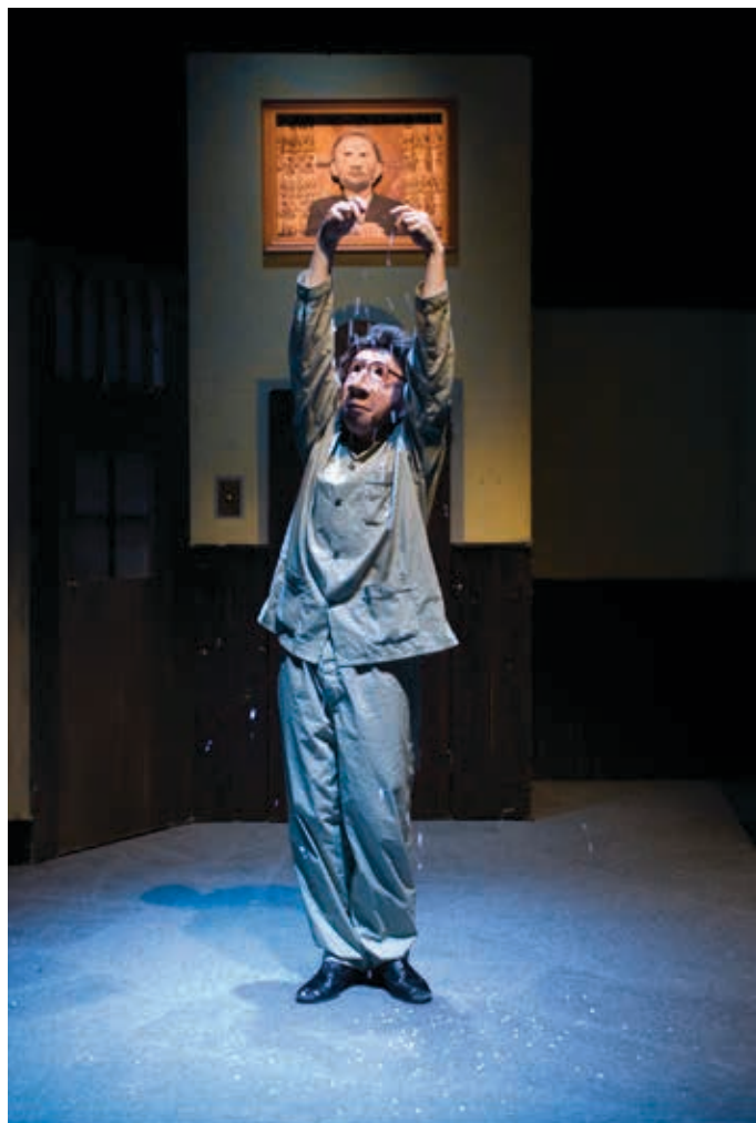
FAMILIE FLOZ - HOTEL PARADISO