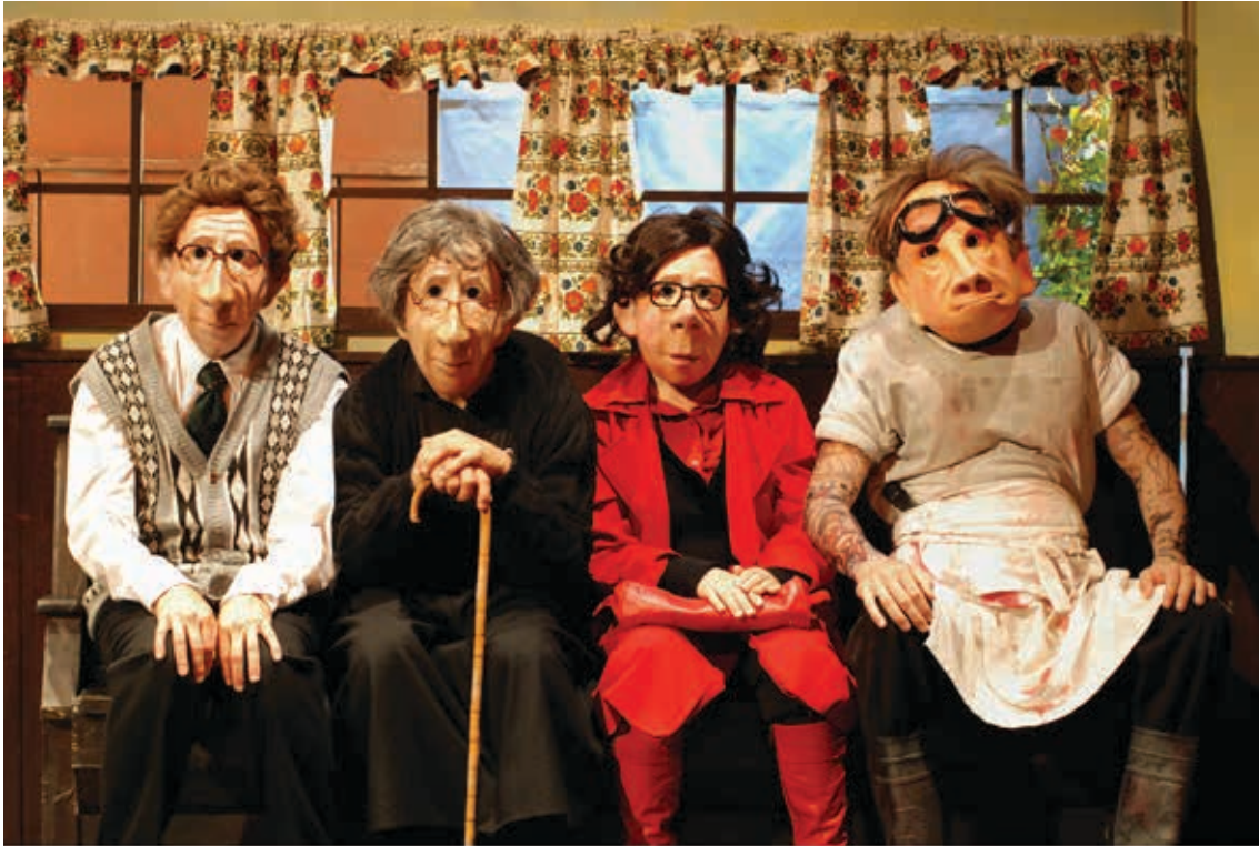
FAMILIE FLÖZ HOTEL PARADISO

C’est au même endroit, en 2008, qu’est jouée la première de “Hotel Paradiso”. L’été 2008, la collaboration avec l’Admiralspalast s’achève. À présent, FAMILIE FLÖZ collabore et produit régulièrement avec la Theaterhaus de Stuttgart et le Théâtre de Duisburg.