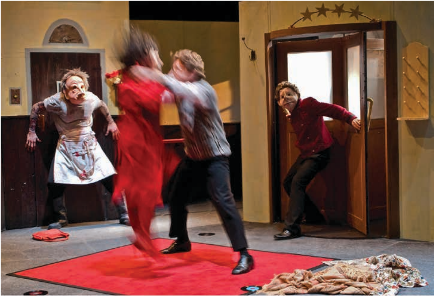
FAMILIE FLÖZ HOTEL PARADISO