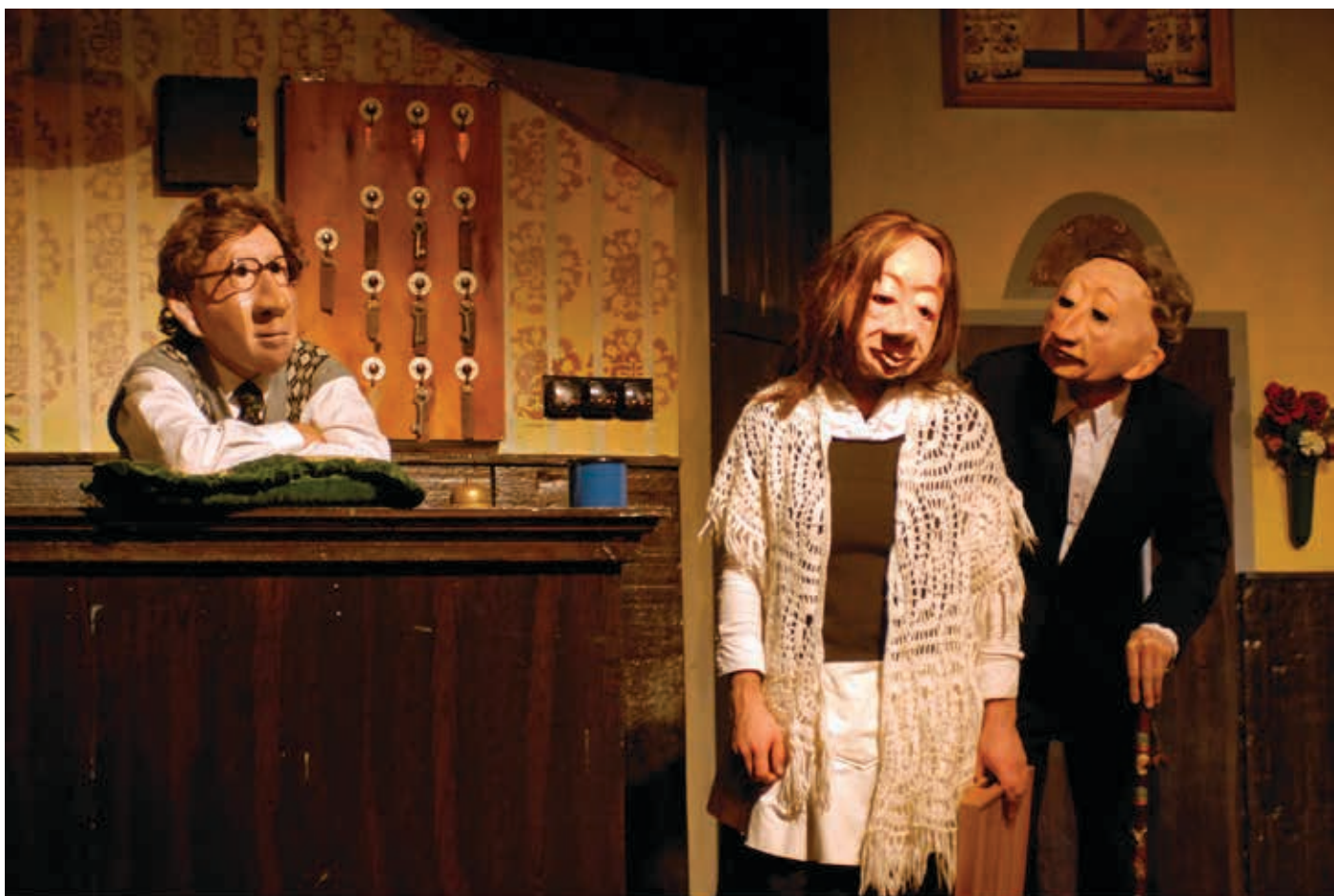
FAMILIE FLÖZ HOTEL PARADISO