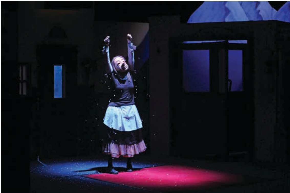
FAMILIE FLÖZ HOTEL PARADISO