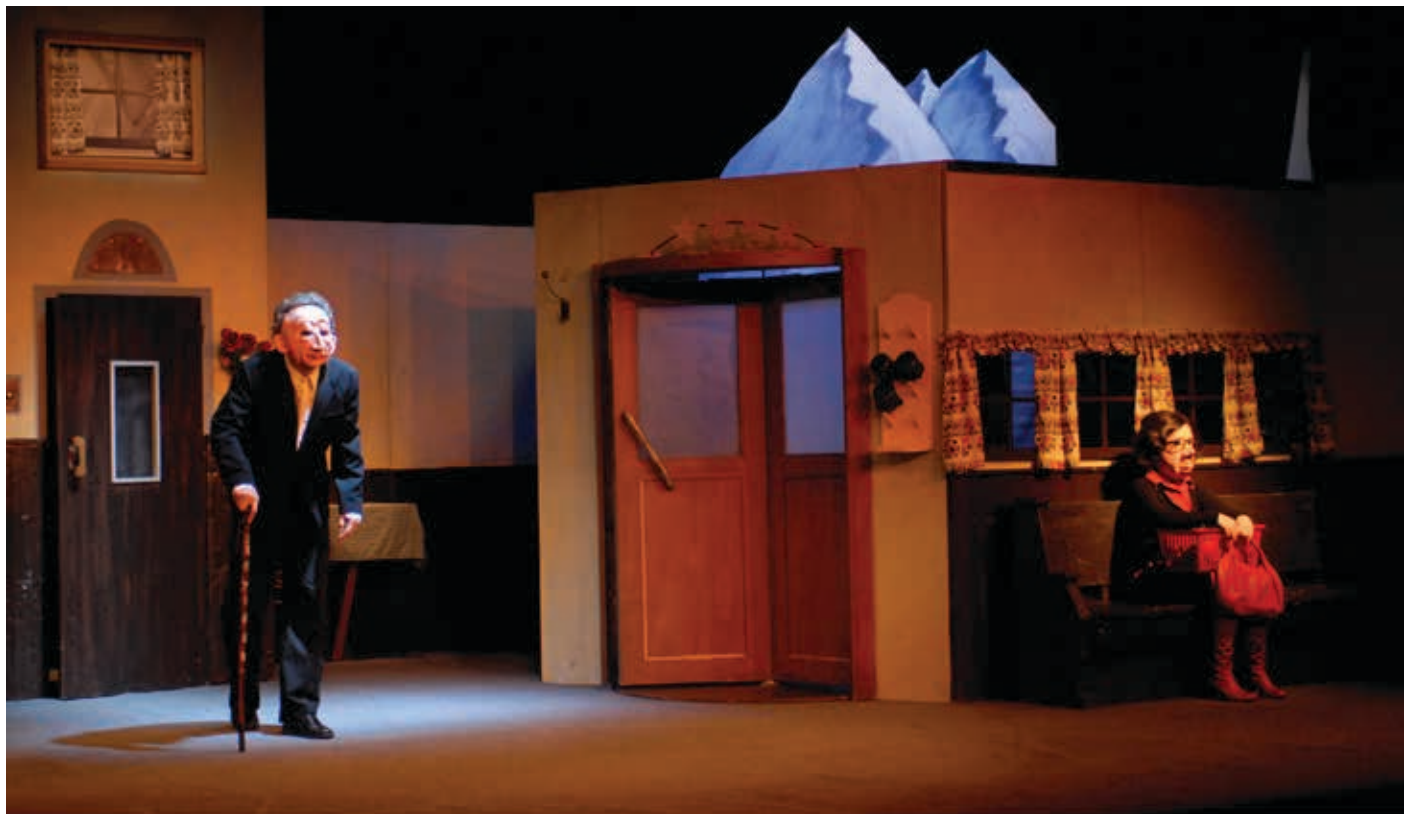
FAMILIE FLOZ - HOTEL PARADISO - FOTO: MARIANNE MENKE