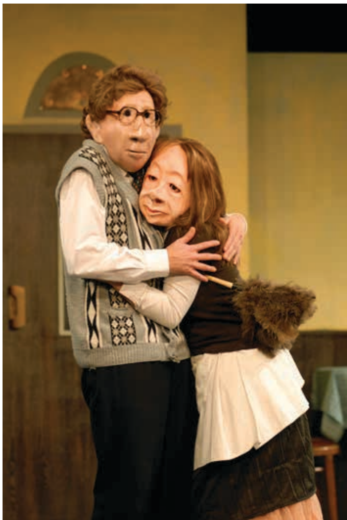
FAMILIE FLOZ - HOTEL PARADISO