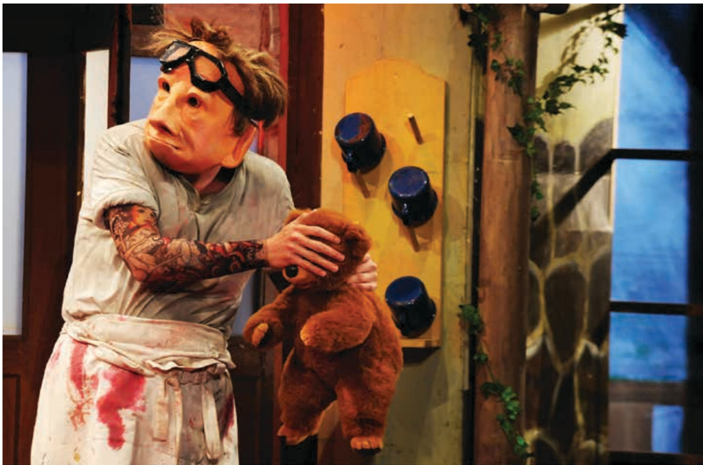
FAMILIE FLÖZ HOTEL PARADISO