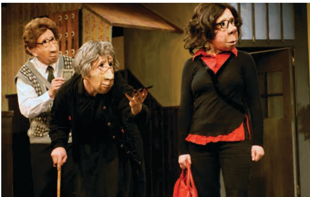
FAMILIE FLÖZ · HOTEL PARADISO

«À la fin, on pourrait jurer que les acteurs ont parlé, rit et pleuré. C'est une expérience théâtrale passionnante.» Süddeutsche Zeitung (All.)